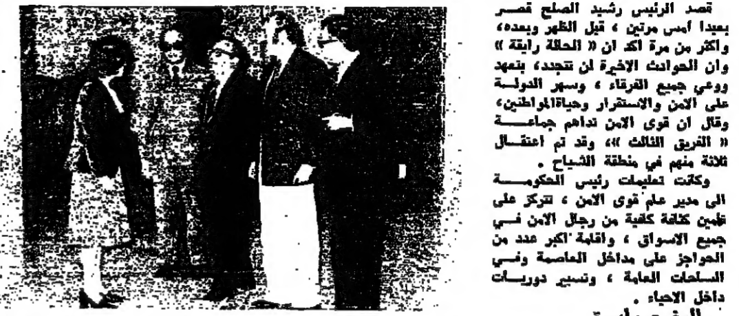
الرئيس الصلح والوزير سامي وعبار لدى وصولهم الى قصر بعد امس، ونسي استقبالهم السيدة ليا كريمة الرئيس فرنجية

في قوى أمن كثر بالبورج ، ومضى معظمه لكل مواطن نتر